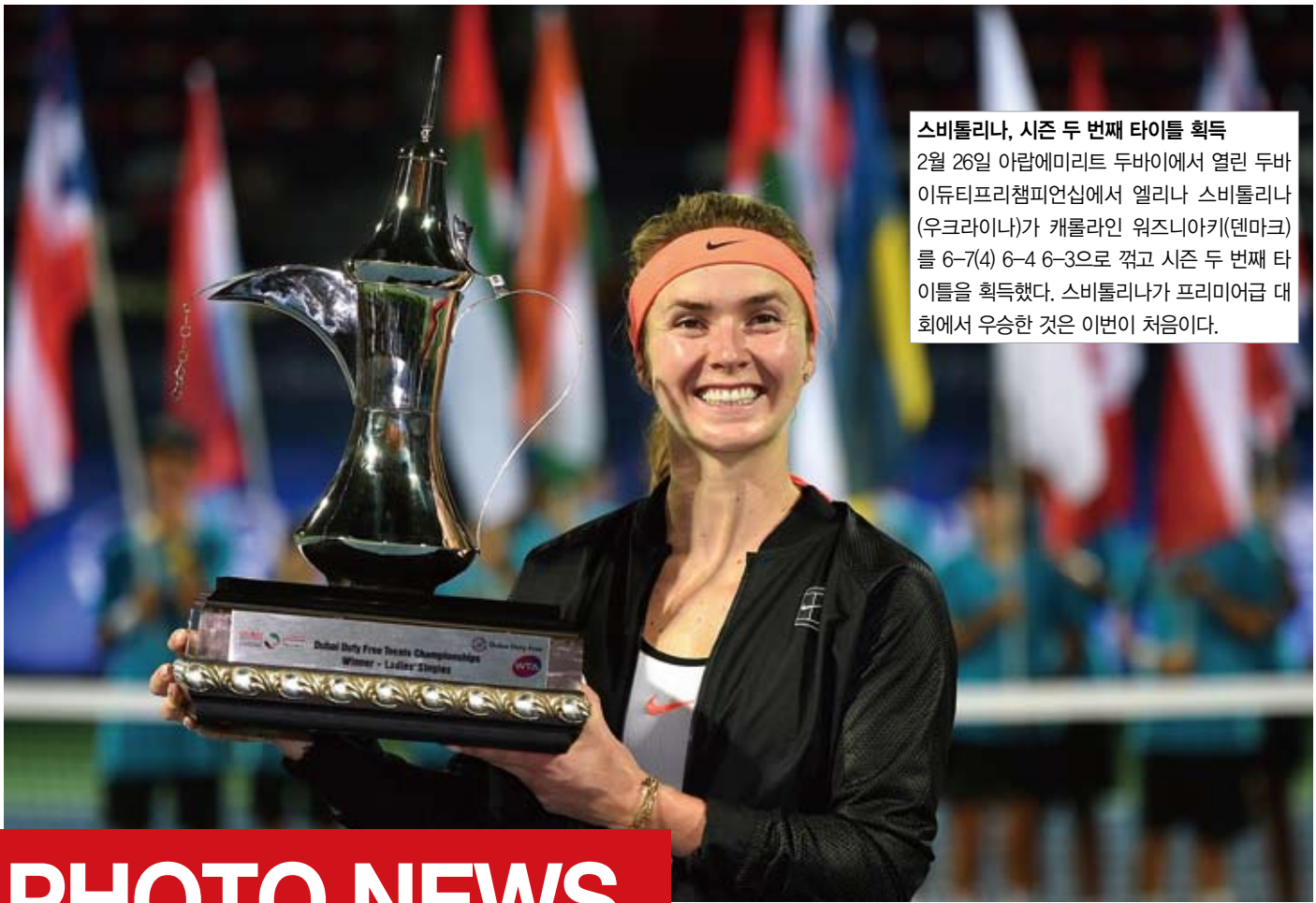
스비톨리나, 시즌 두 번째 타이틀 획득 2월 26일 아랍에미리트 두바이에서 열린 두바이 듀티프리 챔피언십에서 엘리나 스비톨리나(우크라이나)가 캐롤라인 워즈니아키(덴마크)를 6-7(4) 6-4 6-3으로 꺾고 시즌 두 번째 타이틀을 획득했다. 스비톨리나가 프리미어급 대회에서 우승한 것은 이번이 처음이다.